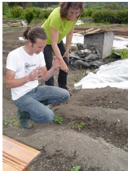
SF / ODLA.MED.P1

FRITIDSODLINGEN OMSÄTTER STORA värden på marknaden men har andra krav på växtmaterial och odlingsmetoder än yrkesodlingen. Europaintegrationen och klimatförändringarna ökar behovet av att fritidsodlingens konsumentintressen bevakas. Samtidigt är det viktigt att sorter som är värda att bevara finns kvar på marknaden. FOR medverkar i arbetet med att bevara den odlade mångfalden och är medlem i Sveriges Konsumenter. FOR bedriver också egna försök med sortprovning.