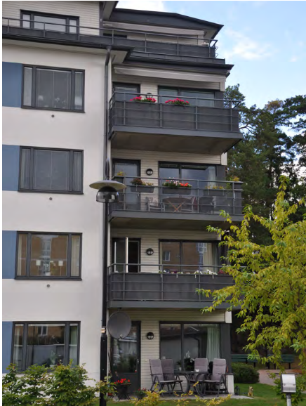
Det finns ungefär 2 miljoner balkonger och 200 000 uteplatser i anslutning till flerbostadshusen i Sverige.

även tillgång till trädgård någon annanstans. På kolonilott fritidsodlar uppemot 100 000 människor.