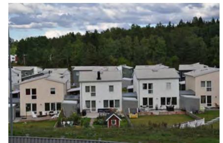
Rad- och kedjehustomten är i medeltal 450 m 2 och villatomten knappt 2 200 m 2 men ingen trädgård blir den andra lik.