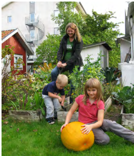
Intresse för stadsodling finns och utvecklas i de större städerna. I 30 kommuner ser man en ökad efterfrågan på kolonilotter.

Intresset för att odla i staden under gemensamma former, som en väg mot ett hållbart samhälle, har ökat under början av 2000-talet. Nya projekt och nätverk, ofta under lösare föreningsformer har tillkommit i de större städerna. Den areella omfattningen är ännu marginell jämfört med annan fritidsodling och odling på kolonilott. Det är engagemanget och uppmärksamheten som riktas på stadsodling som samhällsutvecklande, som visar på fritidsodlingens potential.