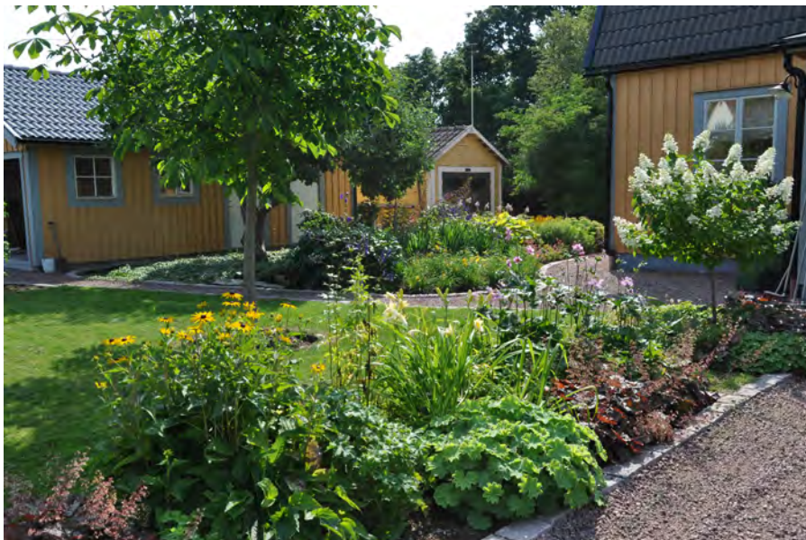
Trädgårdsägare köper trädgårdsrelaterade produkter för omkring 13 miljarder kronor varav plantskoleväxter utgör ungefär 1 miljard kronor. Många vill ha perenner i sina trädgårdar.

Både för enskilda fritidsodlare och för samhället har fritidsodlingen stor betydelse, som inte låter sig mätas i pengar. Hit hör bland annat fritidsodlingens stora rekreationsvärde, som värderas högst enligt trädgårdsägarna själva, och betydelsen för folkhälsan i form av motion och konsumtion av frukt och grönt. Vidare kan nämnas trädgårdarnas estetiska och miljömässiga betydelse, vilket kan vara allt från uppväxtmiljö för barn till betydelse för den biologiska mångfalden. Odling är en pedagogisk resurs för ökad förståelse för naturen och de ekologiska sambanden. Närproducerat kan ge miljöfördelar samtidigt som intresset för trädgård är en bra grund för social utveckling, vilket är grunden i många av de nya stadsodlingsprojekten i våra större städer. Det finns många utforskade möjligheter inom den omfattande fritidsodlingen.