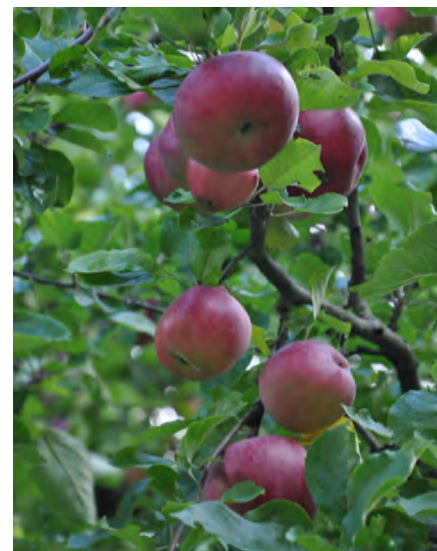
Det finns gott om äpplen i de svenska trädgårdarna.