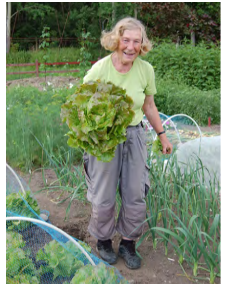
Andelen som trädgårdsarbetar är stor bland äldre. Det är fler kvinnor än män som är uttalat intresserade av trädgård.

Trädgårdsägare intresserar sig i större utsträckning för design nu än tidigare. Vi har mer och mer börjat se trädgården som en del av vårt boende, som ett rum att vistas och umgås i. Här finner man nöje och arbete men framförallt avkoppling. Viljan att odla nyttoväxter, om än i ringa omfattning, ökar hos fler trädgårdsägare.