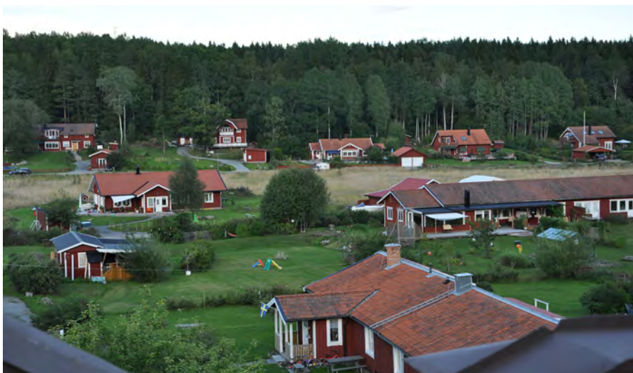
I Sverige finns 2,6 miljoner trädgårdar med en sammanlagd trädgårdsyta på 320 000 hektar. Av dessa finns ungefär 210 000 hektar på landsbygden och 110 000 hektar i tätorterna.

För boende i flerbostadshus är tillgång till odlingsmöjlighet och trädgård inte lika given