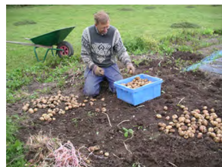
Fritidsodlarna äter och lagrar viktinmässigt mest av egenodlade äpplen och potatis.

Fritidsodlingen har med dagens omfattning och med goda skördar potential att producera uppemot 700 000 ton ätliga grödor till ett värde av 30 miljarder kronor. Fritidsodlingen är större än den yrkesmässiga odlingen i landet med avseende på äpple, vinbär, krusbär, hallon och rabarber. Fritidsodlingen utgör en betydande reservkapacitet för livsmedelsproduktion i en krisituation.